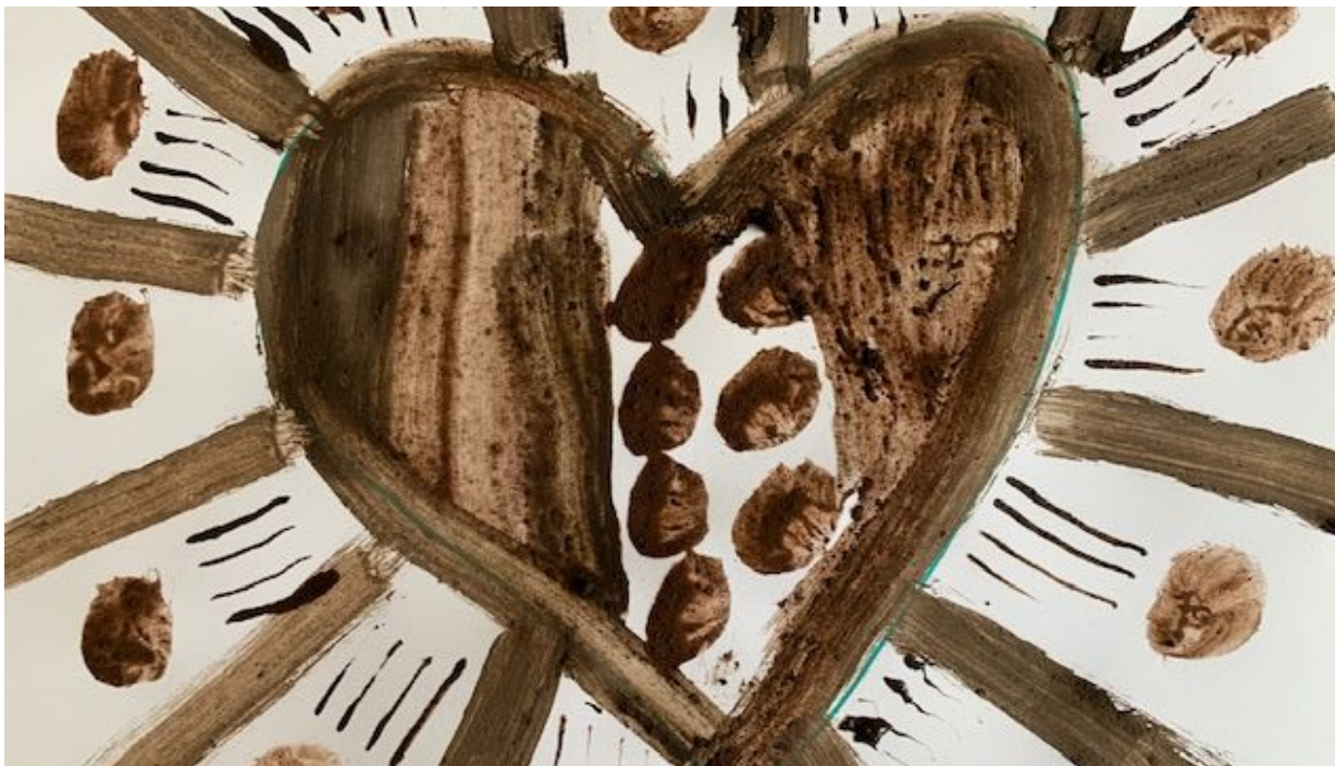
Concepto de la lección y fotografías por Diane Egger-Bovet Creadas para ARTS@Home y el Museo de Arte del Valle de Sonoma Usadas con autorización. Todos los derechos reservados.